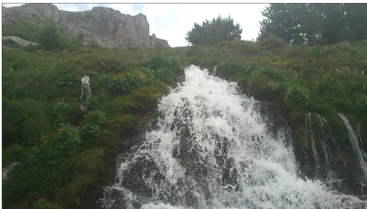
Figura 5.5.1 Muestreo del punto 280880008 MANANTIAL DEL RIGÜELLO (T.M. Aisa, Huesca), realizado el 24/06/2014.